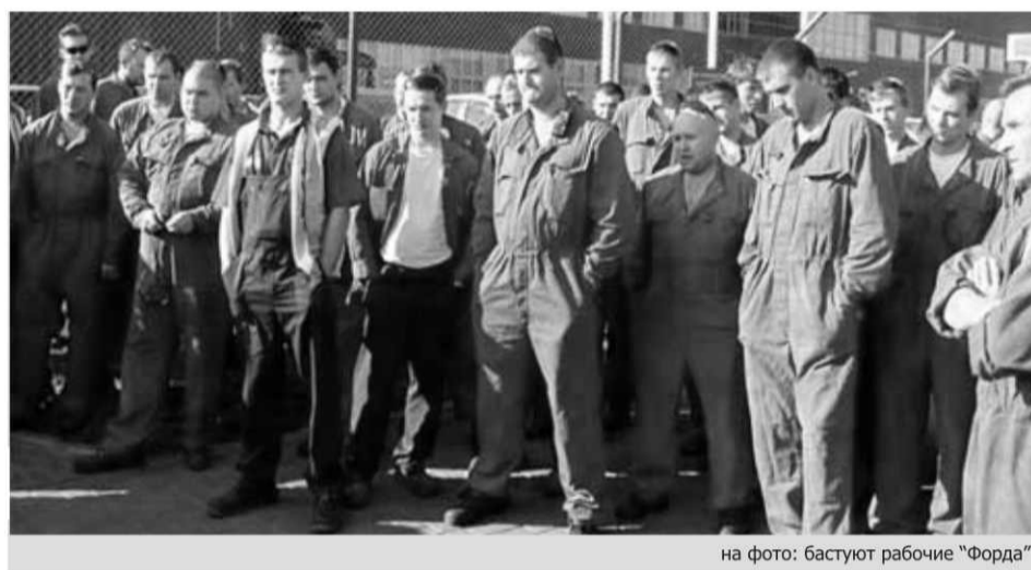
на фото: бастуют рабочие "Форда"

Недавно РИА Новости озвучило такую точку зрения председателя Федерации независимых профсоюзов России (ФНПР) Михаила Шмакова: «В условиях последствий мирового экономического кризиса в Российской Федерации применение такой меры, как забастовка, является крайней и на нынешнем этапе неэффективной формой разрешения трудовых конфликтов». Гораздо более эффективным инструментом разрешения трудовых споров сейчас Шмаков считает «институт социального партнерства, выполнение пунктов коллективного договора и конструктивного переговорного процесса между профсоюзами, работодателями и властью».